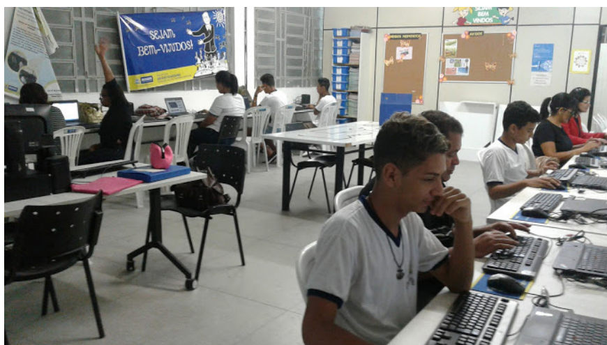
Figura 1. Alunos trabalhando no projeto de criação de blogs, na Utec Nóbrega.

Trabalhamos uma vez por semana durante dois meses para que o blog adquirisse uma apresentação adequada a sua temática e os alunos desenvolvessem a habilidade necessária para trabalhar com blog autonomamente (Figura 1).